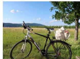
Top 10 Radtouren für Genussradler: die schönsten RADWEGE NIEDERÖSTERREICHS