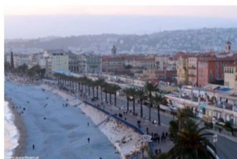
NIZZA Kurztrip: Wintersonne an der Côte d'Azur