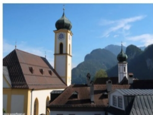
Mein Best of TIROL: schöne Orte, interessante Plätze und wundervolle Naturparadiese

Facebook +1.100 Follower Instagram (im Aufbau) Pinterest (im Aufbau)