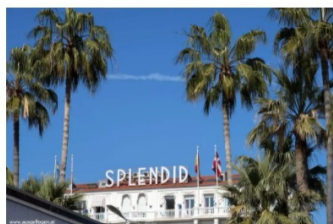
Ein Spaziergang in CANNES: mehr als Stars und Sternchen

Blogbeiträge und Social Media Postings werden als Werbung gekennzeichnet. Die Verlinkung erfolgt auf No-Follow-Basis..