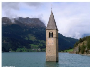
Rund ums OBERINNTAL: vom Reschenpass bis zum Silvrettapass Veröffentlicht am 24. September 2020